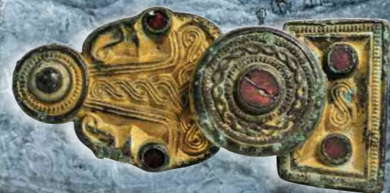
Die Fruchtbarkeitsgöttin Freyja besaß einen magischen Halsschmuck, das BRISINGAMEN . Vielleicht handelte es sich dabei um eine Rückenknopffibel wie dieses Bronzevergoldete Exemplar mit Granateinlagen aus Barsaldersbacke, Gröttingbo, Gotland.

der Wikingerzeit, wie man ihn sich ausgehend von aktuellen Forschungen in etwa vorstellen kann.