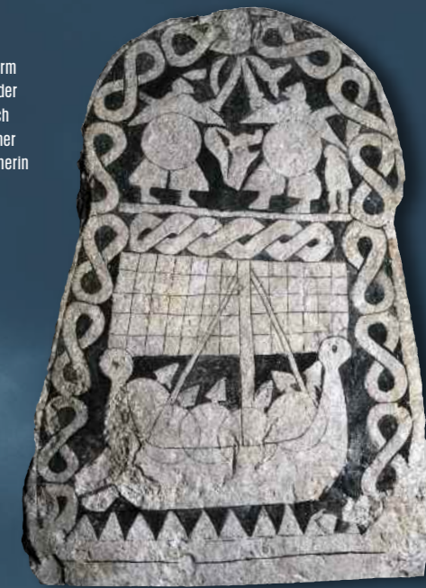
Dieser BILDSTEIN aus Näs auf Gotland stellt einen Zweikampf und eine Schiffsreise dar – Motive, die vermutlich auf Jenseitsvorstellungen zurückgehen. In der Ausstellung ist der Bildstein im Original zu sehen.