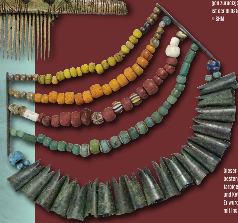
Dieser HALSSCHMUCK besteht aus verschiedenfarbigen Glasperlen, Anhängern und Kettenhaltern aus Bronze. Er wurde einer Frau auf Gotland mit ins Grab gegeben.